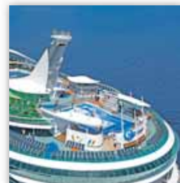
Liberty of the Seas de Royal Caribbean

La feria, cuyo acceso será gratuito, servirá para dar a conocer las últimas novedades de la temporada así como las distintas salidas ofertadas para los distintos mares y océanos. Será los próximos 4 y 5 de febrero en el Gran Hotel. •