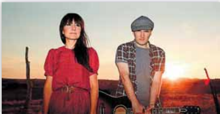
La gira de presentación del disco ha logrado un gran éxito

La gira de presentación del disco también ha cosechado un notable éxito. En el 90% de los conciertos celebrados por el territorio nacional hasta el momento ha colgado el cartel de no hay entradas y ha tenido gran éxito de crítica. •