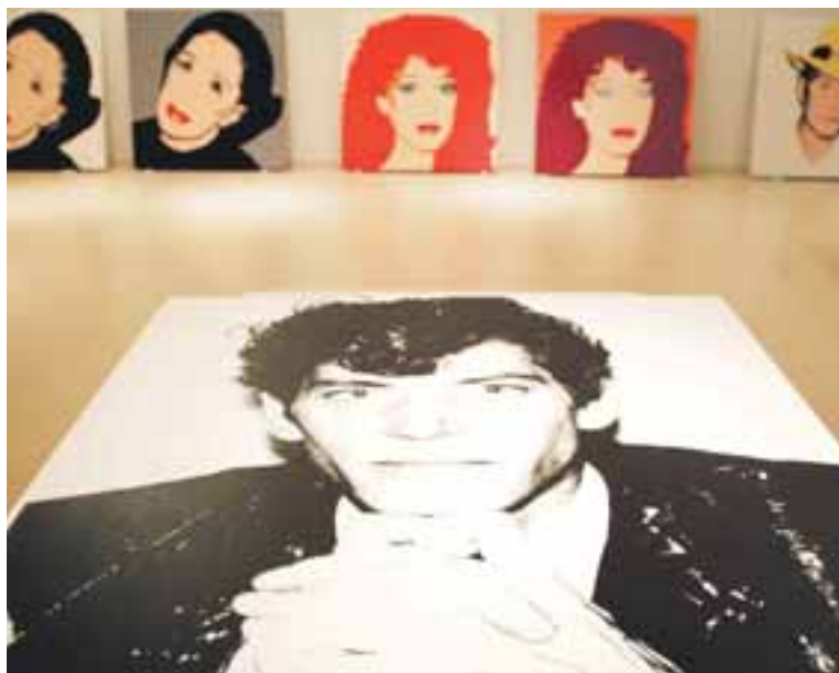
Retrato de Robert Mapplethorpe, por Warhol