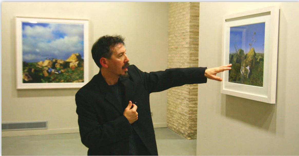
El artista expone en el Paraninfo hasta el próximo 13 de junio