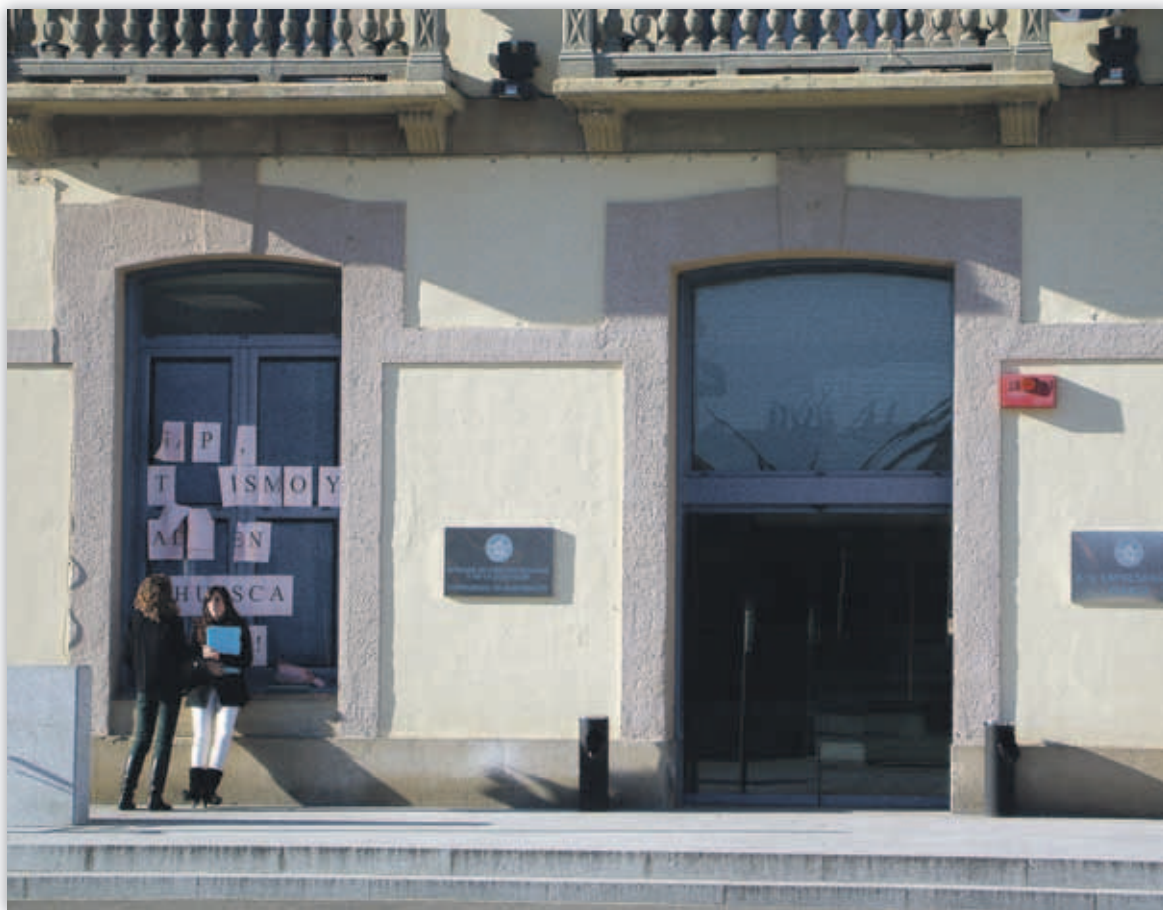
El campus oscense reclama que se mantengan los estudios de ADE

El diputado del PAR Javier Callao se mostró favorable a esta proposición y destacó la trayectoria de "formación y preparación" de la Escuela de Empresariales de Huesca y su carácter "puntero". Además, consideró que no es incompatible el establecimiento de dos grados como el de Turismo y Empresariales porque "no se hacen competencia" y apostó por el establecimiento de dos grupos de Grado de ADE en Zaragoza, uno en Huesca y otro en Teruel.