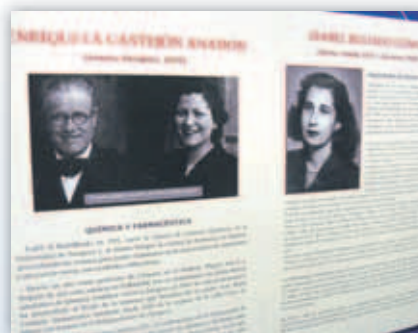
Veinte imágenes en blanco y negro conforman la exposición "Pioneras de la Educación de Aragón"