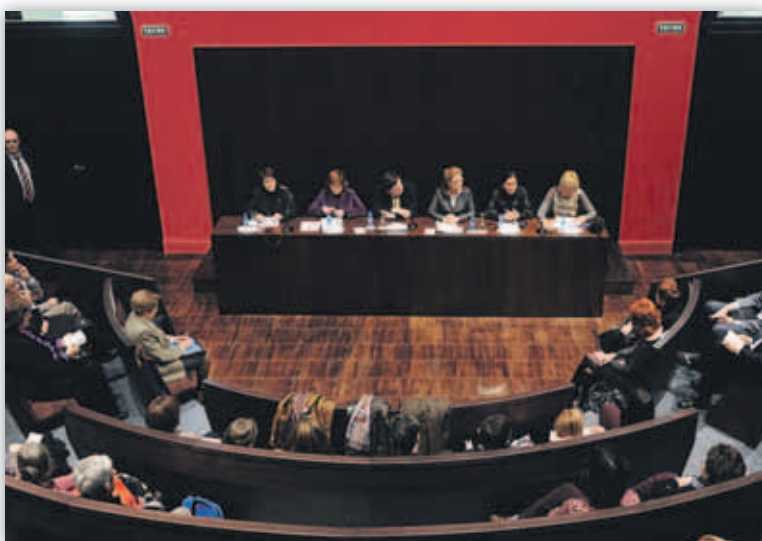
El Paraninfo celebró el centenario del libre acceso de la mujer a la universidad el pasado 8 de marzo

Más de 16.000 mujeres estudian a día de hoy en las aulas de la Universidad de Zaragoza, pero desde su incursión en este ámbito sólo han pasado cien años. En esta conmemoración del libre acceso de la mujer a la universidad, la institución ha querido recordar a estas pioneras que abrieron el camino hacia la igualdad de oportunidades.